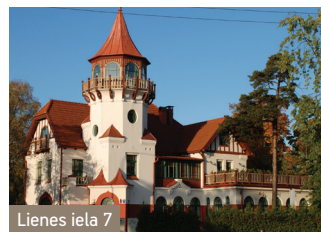
Lienes iela 7