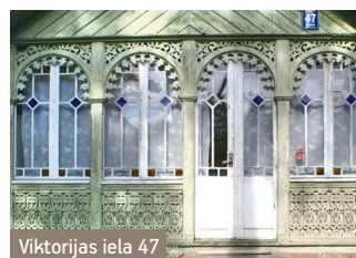
Viktorijas iela 47