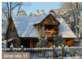
Jūras iela 33