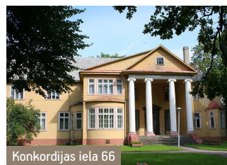
Konkordijas iela 66