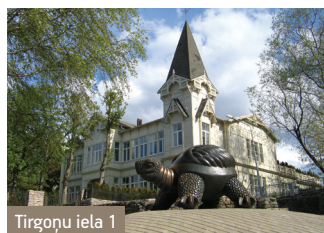
Tirgoņu iela 1