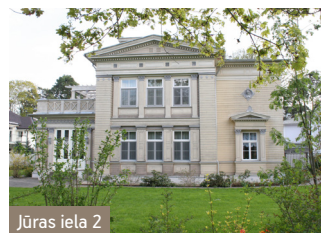
Jūras iela 2