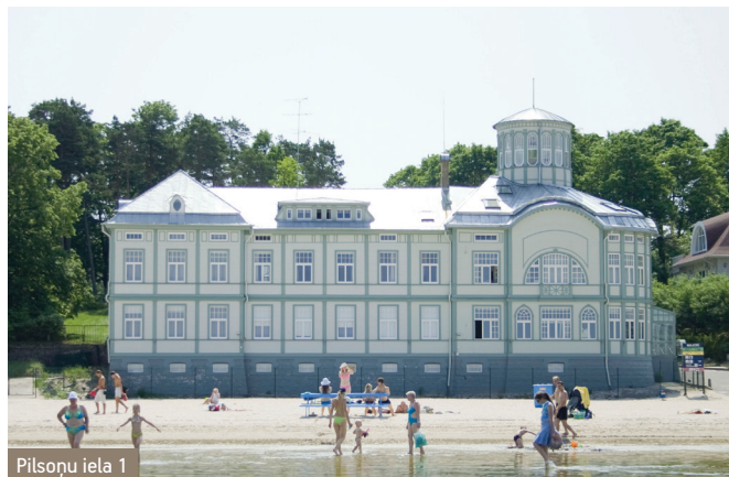
Pilsuņu iela 1

Tagad Majori kļuvuši par Jūrmalas centrālo daļu. Jomas iela ir gājēju iela, un 1999.gadā veiktā rekonstrukcija to padarījis īpaši pievilcīgu. Atjaunotas vēsturiskās koka apbūves ēkas – arhitektūras pieminekļi Jūras un Jomas ielās. Populāri ir ikgadējie Jomas ielas svētki, atdzimuši sarīkojumi bijušā Horna dārza teritorijā. Par galveno satiksmes zonu kļuvusi Lienes iela. Kā atdalīta "kabata", kurā var nokļūt pa Dzintaru gaisa pārvadu, aiz dzelzceļa palikusi teritorija ap muižas ēku.