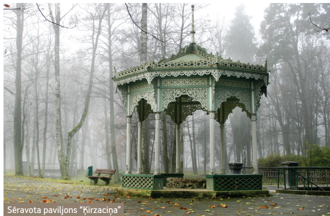
Sēravota paviljons “Ķircaciņa”

Ķemeri patstāvību saglabāja līdz 1959. gadam, kad notika iekļaušana Jūrmalas pilsētas sastāvā. Trīsdesmit gadus Ķemeri bija padomju kūr- ortpilsētas sastāvdaļa. 1997.gadā Ķemeros un apkārtnē nodibināja Ķemeru nacionālo parku ar centru „Meža mājā” . Ārstniecības iestāžu slēgšana, objektu privatizācija un ielgušie vai neuzsāktie re- montdarbi 20. gs beigās un 21.gs ir strauji mainījuši Ķemeru raksturu. Nepievilcīgā stāvoklī atrodas vēsturiskais Ķemeru parks ar mazajām arhitektūras formām, celiņiem un tiltiņiem. Ķemeru kūrorta atjauno- šana ir Jūrmalas pilsētas nākotnes viena no aktuālākajām iecerēm.