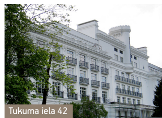
Tukuma iela 42