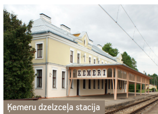
Ķemeru dzelzceļa stacija