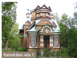
Katedrāles iela 1