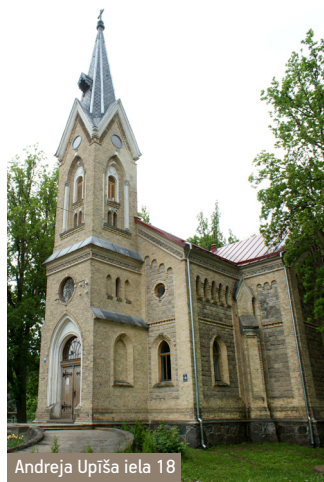
Andreja Upiša iela 18